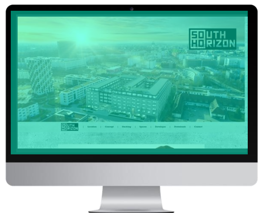
Weiterleitung von den Werbemitteln zu Ihrer bestehenden Projektseite