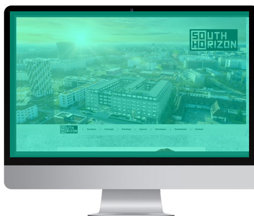
Weiterleitung von den Werbemitteln zu Ihrer bestehenden Projektseite