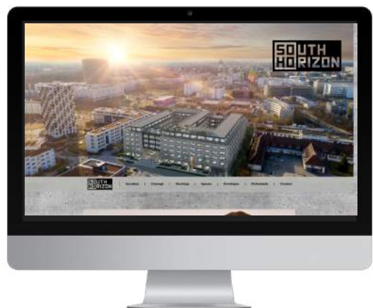
Weiterleitung von den Werbemitteln zu Ihrer bestehenden Projektseite